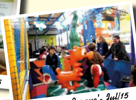
Um 'Dia no Parque' - Jul/15