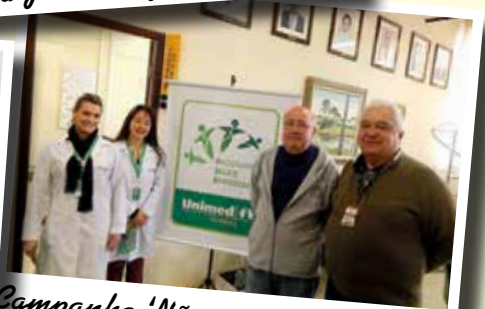
Campanha 'Não cai nessa' - Jun/15