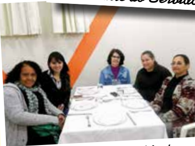
Dia das Mães - Mai/15