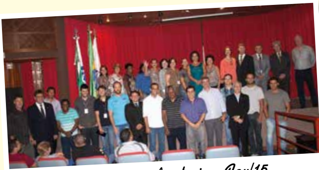
Posse da nova diretoria - Fev/15

Confira quais foram os eventos e as atividades da Assutef-CT durante 2015!