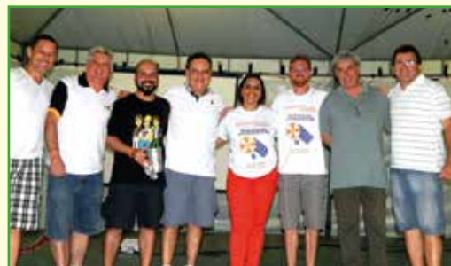
Dirigentes e presidentes das Assutefes se reúnem para a cerimônia de abertura do IV Assutefes na Praia.

Fechando o domingo (dia 1º), aconteceu a 'Noite do Flashback', onde todos puderam relembrar antigos sucessos musicais de décadas passadas. O encontro social, esportivo e de lazer das Assutefes foi muito divertido e participativo e todos já contam os dias para o próximo em 2016!