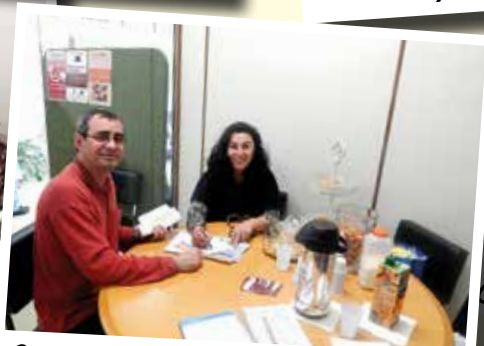
Campanha Projeção Seguros - Mai/15