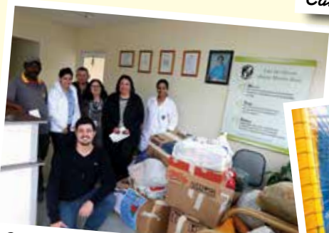
Campanha 'Doe Calor' - Jul/15