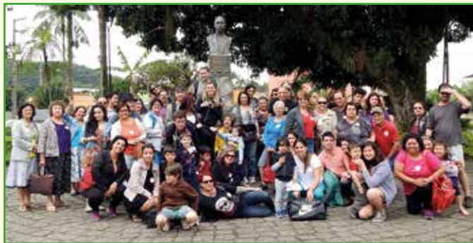
Grupo da Assutef-CT lotou um dos vagões na viagem para Morretes.

Em outubro, o que não faltou para os associados e sua família foram opções de atividades e passeios. No dia 17 de outubro, os Departamentos de Aposentados e Turismo, em parceria com a Serra Verde Express, promoveram o Passeio de Trem Curitiba-Morretes. Apesar do tempo chuvoso e nublado, foi possível admirar as belas paisagens da região da Serra do Mar. Na chegada ao litoral, todos saborearam um delicioso almoço, onde foi servido o prato típico da região, o barreado, além de peixe e camarão. Logo após, os participantes puderam passear pelos recantos históricos e turísticos da cidade e apreciar o artesanato local.