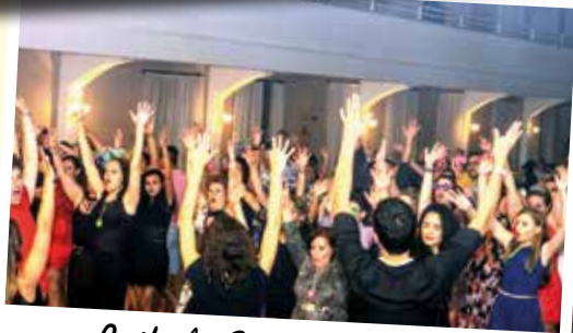
Baile do Servidor - Set/15