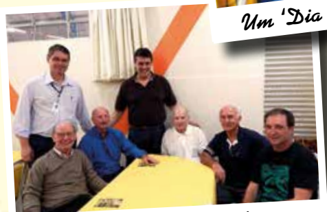
Dia dos Pais - Ago/15