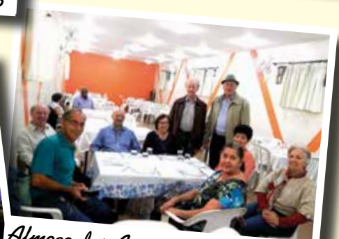
Almoço dos Aposentados - Mar/15