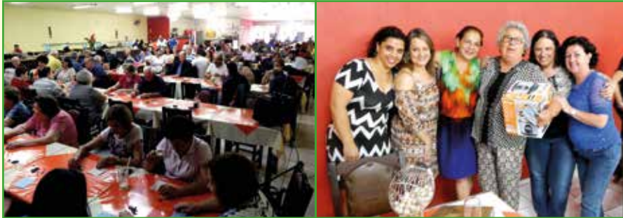
Após um delicioso almoço, os associados aposentados participaram do tradicional bingo.

Um almoço especial, no dia 12 de dezembro, reuniu os associados aposentados. O evento, promovido pelos Departamentos Social e de Aposentados, aconteceu na Churrascaria Central Grill, onde ocorreu um animado bingo com vários brindes.