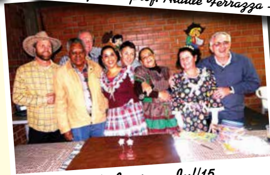
Festa Junina - Jul/15