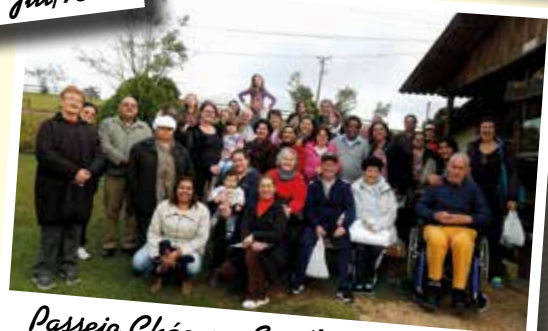
Passoio Chácara Sant'Anna - Jul/15