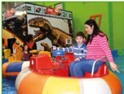
Na Festa da Criança os pais puderam brincar e se divertir com seus filhos.

No dia seguinte (18), a manhã começou com a comemoração do Dia da Criança, que reuniu e divertiu pais e filhos, no Parque Unipark, na Vila Fanny. Durante todo o evento, eles puderam aproveitar os brinquedos e foi servido um delicioso lanche com salgadinhos e docinhos. A criançada ain-